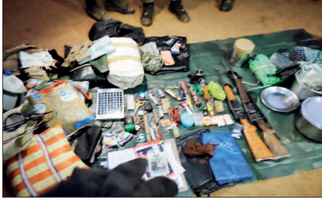
एक लाख का इनामी सक्रिय माओवादी गिरफ्तार पुलिस को मिली सफलता

सुकमा जिले के चिंतलनार थाना क्षेत्र में बुधवार को नक्सल आपरेशन पर निकली संयुक्त फोर्स व नक्सलियों के बीच 1 घंटे से अधिक फायरिंग होती रही। मुठभेड़ स्थल से जवानों ने भारी मात्रा में विस्फोटक व हथियार बरामद किया है। जिस तरह से नक्सली हथियार छोड़कर भागे और मौके पर मिले खुन के धब्बे से उससे कयास लगाया जा रहा है कि 5-6 नक्सलियों को गोली लगी है, जिन्हें साथी नक्सली अपने साथ ले जाने में कामयाब रहे।